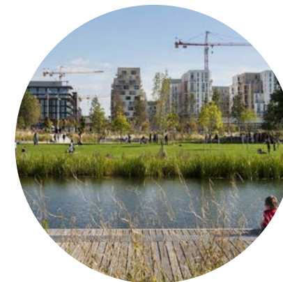
Grand Parc des Docks de Saint-Ouen