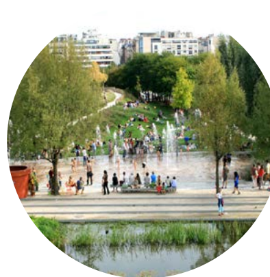
Parc Martin Luther-King, Paris 17 e