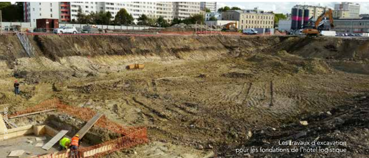
Les travaux d'excavation pour les fondations de l'hôtel logistique